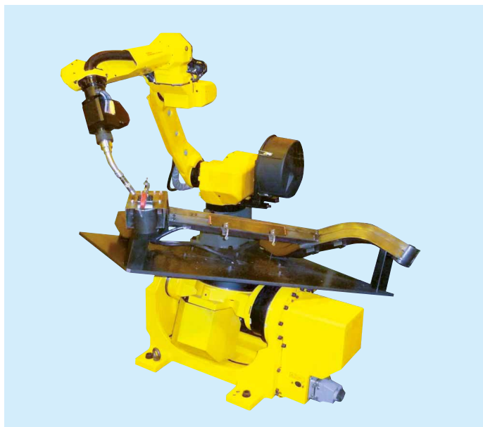
使用伺服焊炬进行汽车零件的弧焊