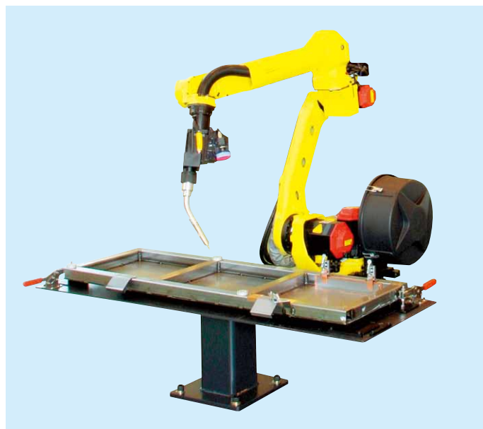
利用 i RVision进行建材零件的弧焊