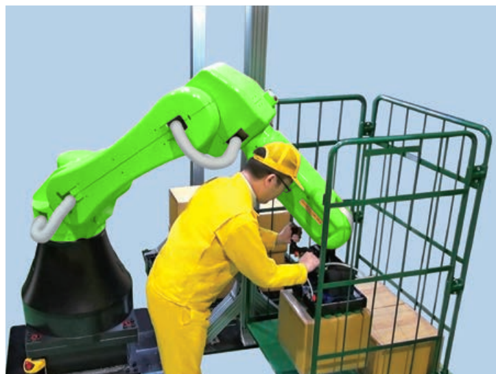
使用手持引导功能进行工件搬运