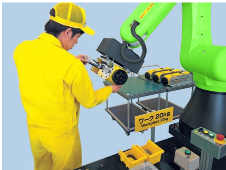
与机器人协同作业进行零件组装