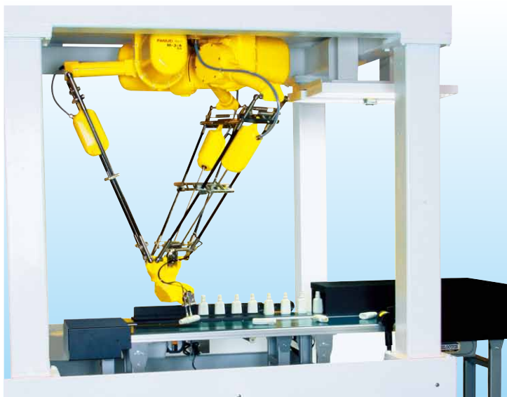
使用M-3 i A/6A把空瓶竖起来并整列